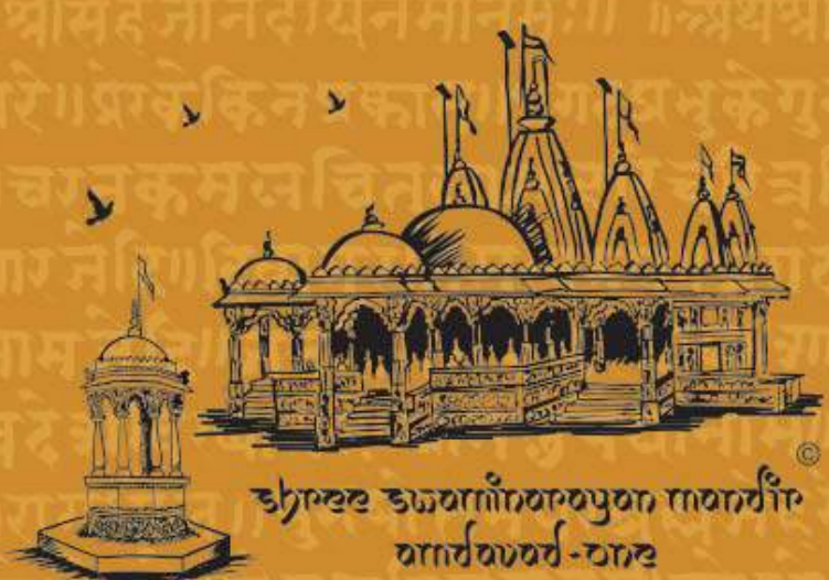
उद्योग उद्योगांतराद्युक्तानां वीर वार्धवार्ध-वार्ध

॥ श्रीसहजानंदायनमोनमः ॥ ॥ अथ श्रीहरिच तरे ॥ प्रकेकिनप्रकास ॥ प्रगटप्रभुकेगुनदिकु ॥ चरनकमलचित्तलार ॥ हरिचरित्रचिन्ता धारजेदि ॥ दिग्गमुरतिमुखरुप ॥ प्रगटमुरा नामजेदि ॥ जनहिततपकरतोया ॥ शापनि वदे शविख्यातदे ॥ धामभुपेयानामा ॥ हरिप्र ॥ रागधोल ॥ पुरुषोत्तमपरब्रह्मतेदरे ॥ ध्या शोमोरेग ॥ चेत्रशुदितेनवमीजोरेग ॥ शुर गेतेसमयबन्योमुखकारिग ॥ हरिजनने कारेग ॥ मेजेउतस्याभुमिकेरोभारग ॥ घम