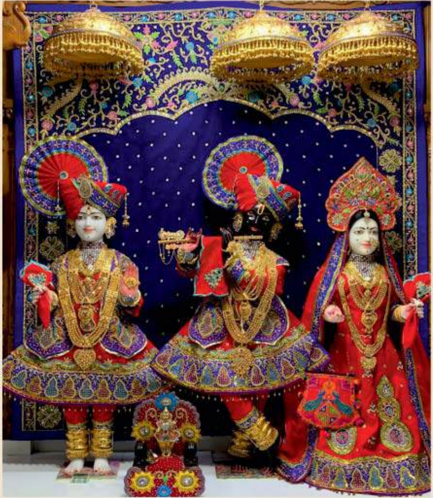
श्री राधाकृष्णदेव श्री हरिकृष्ण महाराज - शिकागो