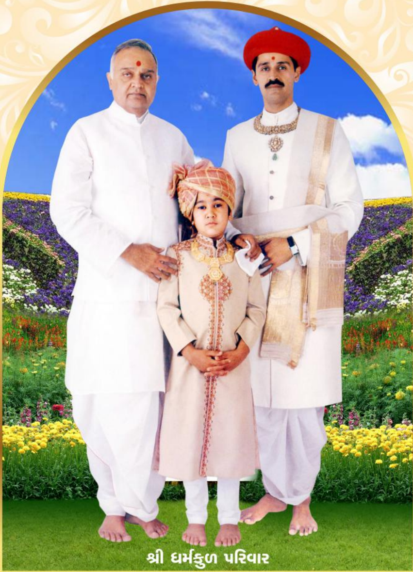
श्री धर्मकुल परिवार