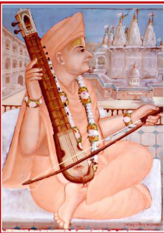
સ.ગુ. શ્રી પ્રેમાનંદ સ્વામી

૩ - તુમ્હારો તવ હરિભક્તકો - હે દયાળુ ! તમારો અને તમારા કોઈ પણ હરિભક્તનો દ્રોહ કબુ ન હોય - દ્રોહ ક્યારેય ન થાય એવી કૃપા કરજો. ગઢડા મધ્ય ના ૪૦ માં વયનામૃતમાં સ્વામિનારાયણ ભગવાન કહે છે કે 'જાણે અજાણે મને, વચને, દેહે કરીને જે કાંઈ ભગવાનના ભક્તનો દ્રોહ બની આવ્યો હોય તો તેના નિવારણ કરાવ્યા સારું એક દંડવત પ્રણામ અધિક કરવો અને અમે એમ જાણ્યું છે જે ભગવાનના ભક્તનું દ્રોહ કરીને જેવું જીવનું ભુંડું થાય છે અને એ જીવને કષ્ટ થાય છે તેવું કોઈ પાપે કરીને નથી થતું.